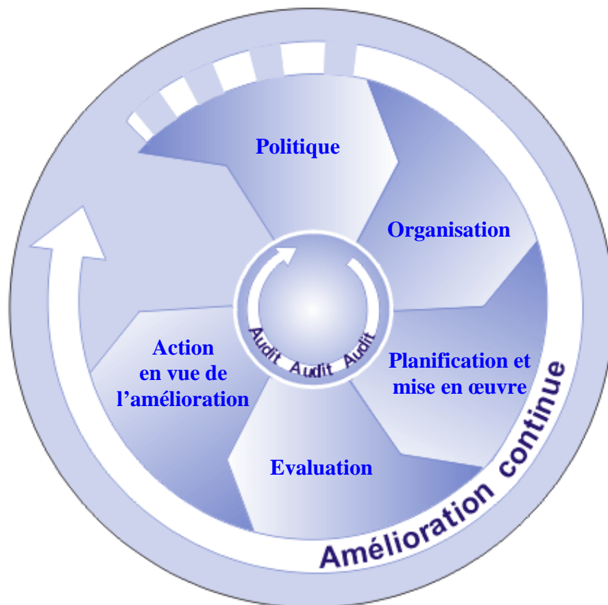
Figure 2. Éléments principaux du système de gestion de la sécurité et de la santé au travail

La santé et la sécurité au travail, y compris le respect des prescriptions de sécurité et de santé au travail applicables dans la législation et réglementation nationales, sont la responsabilité et le devoir de l'employeur. L'employeur devrait jouer un rôle de premier plan dans les activités relatives à la sécurité et à la santé au travail dans l' organisation et faire le nécessaire pour établir un système de gestion à cet effet. Ce système devrait prévoir les éléments essentiels – politique, organisation, planification et mise en œuvre, évaluation et action en vue de l'amélioration – présentés dans la figure 2: